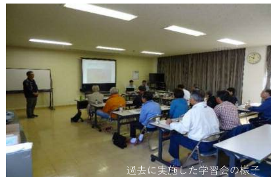
過去に実施した学習会の様子

講師：廃棄物対策課職員、時間：15分程度 ※出前講座は事前エントリーを行い、開催を希望される団体を対象に実施します。 ※実施時期や場所については、団体代表者と別途調整させていただきます。