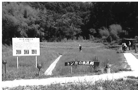
図3 確認された湿地 (モートンイト)