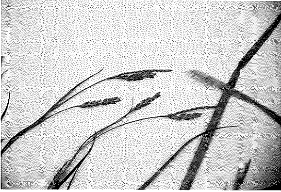
写真2 モエギスゲの小穂