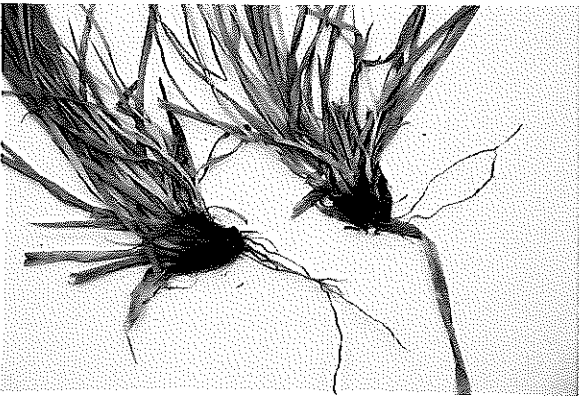
写真3 モエギスゲの基部(葉鞘部)