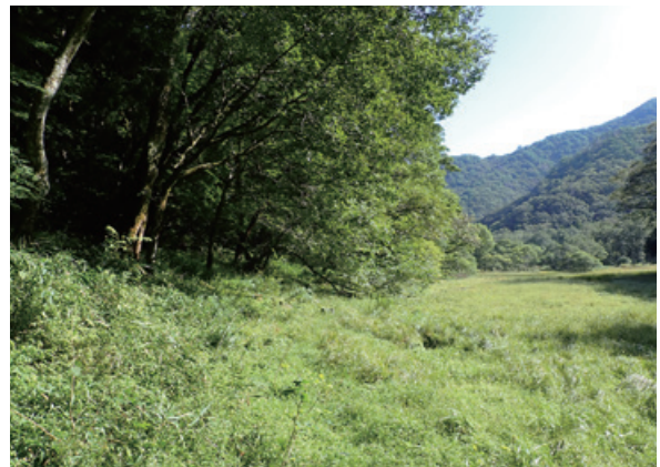
図6 生育環境(北岸部) 2025.10.1