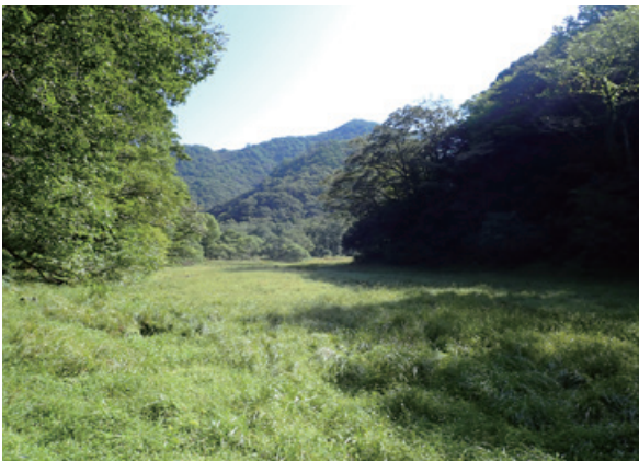
図4 全景(沼奥部を望む) 2025.10.1