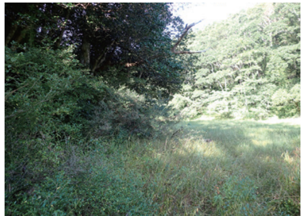
図5 生育環境(南岸部) 2025.10.1