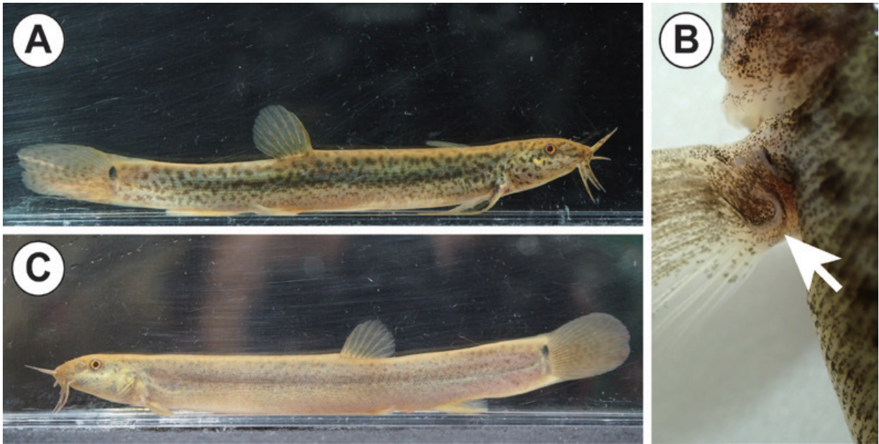
図3 採集したドジョウ Misgurnus anguillicaudatus . A: 全長108 mm のオス個体. 全体に不規則な斑紋が見られる. B: A 個体の胸鰭の拡大写真. 骨質盤の後端(矢印)は丸い. C: 全長107 mm のメス個体. 体表面に斑紋が発達しない.

の魚類が水鳥を媒介として受動分散する可能性があることが示されている. 例えば Lovas-Kiss et al. (2020) は, マガモの排泄物中から回収したコイとギベリオフナの卵が, 極めて低い確率ながら孵化しうることを実験によって明らかにし, 一部の魚類が被食を介して分散する可能性を示した. また Yao et al. (2024) は, アオサギが水草とともにミナミメダカの卵を足に付着させて移動することを実証実験により確かめ, 付着を介して分散する可能性があることを指摘している. しかし, これらの事例で対象とされた魚類とドジョウでは, 産卵形態および卵の性質が異なる. コイは20万-70万粒程度(宮部ほか, 1976)の卵を, 水面近くにある水草や抽水植物, ヤナギ類の根などに産みつけるとされており(馬淵ほか, 2025), 水鳥が摂食する水草に多量に混入する可能性がある. 一方, ドジョウは体長約100 mm の個体が有する卵の数は約3000粒とされている(中島・内山, 2017). その卵は湿地や水田の水草やイネに産み付けられるが, その粘着性は弱く, 多くは底質に落下して泥にまみれながら発生するとされており(宮部ほか, 1976), 水鳥によって偶発的に大量に摂食される可能性は極めて低い. また, 卵の粘着性が弱いことから, 水鳥による付着分散も考えにくい. 魚類の鳥類媒介分散はきわめて低頻度であるとされており(Lovas-Kiss, 2024), さらにドジョウの産卵形態を考慮すると, その発生頻度は相対的に低いと考えられる. 一方, 室ノ内池にはかつてコイが放流された記録がある(石村, 1962, 1967; 大氏, 1971; 大